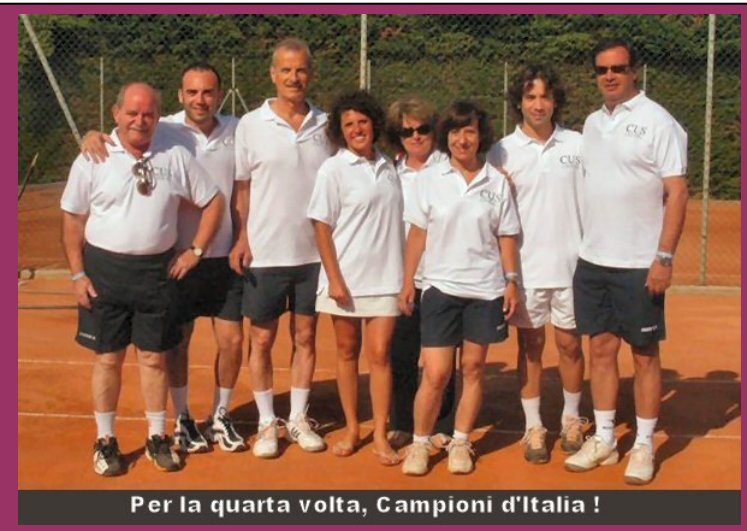
Per la quarta volta, Campioni d'Italia !

La manifestazione si è conclusa con la cerimonia di premiazione (che ha creato alla squadra un grosso problema: quello del trasporto sino a Catania delle "gigantesche" coppe messe a disposizione dal Comitato Organizzatore) e con l'impegno della squadra di realizzare nel 2010 una splendida "cinquina"!!